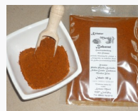
Baharat Gewürzmischung ohne Glutamat / 50 g 1.30EUR